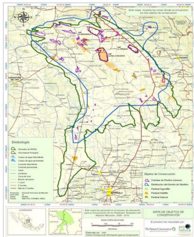
Figura 1. Región Terrestre Prioritaria No. 80, praderas del Tokio y objetos de conservación.

La región se caracteriza por la presencia de endemismos y relaciones ecológicas complejas. Esta zona también es importante para aves residentes y migratorias como el chorlo llanero ( Charadrius montanus ), el zarapito pico largo ( Numenius americanus ), la lechuza pocera ( Athene cunicularia ) y diferentes especies de gorriones (PCPTAM, 2007).